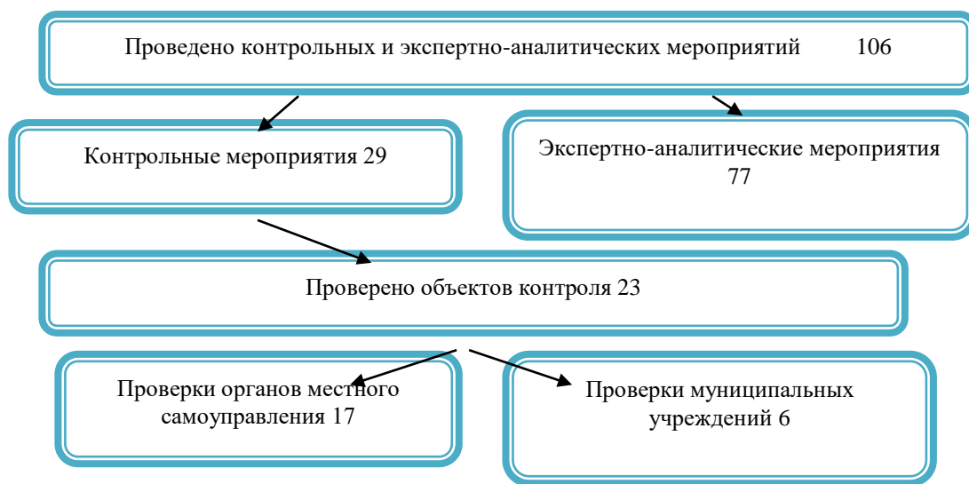
Рис. 1. Контрольная и экспертно-аналитическая деятельность в 2022 году

В течение прошедшего года проведено 29 контрольных и 77 экспертно-аналитических мероприятий, в том числе подготовлено 30 экспертиз нормативных правовых актов. Проверено 23 объекта (рис. 1 Контрольная и экспертно-аналитическая деятельность в 2022 году).